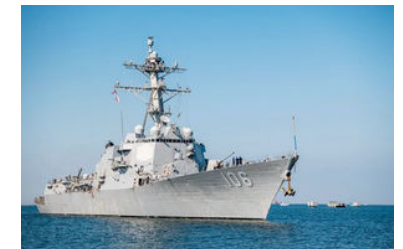
US military and Coast Guard ships as seen near Port-au-Prince on February 3, 2026.