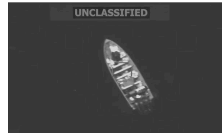
Venezuelan fishing vessels targeted as "narcoterroists" by Trump military strikes, September 2025

Cela s'accompagne d'une répression domestique à l'intérieur des États-Unis, incluant des attaques accrues contre les migrants, des meurtres, des détentions massives et des déportations par l'ICE, des déploiements militaires, des arrestations, du harcèlement et de la violence d'État contre la classe ouvrière américaine. Trump fait aussi des menaces d'annexions territoriales et d'agression militaire contre le Groenland, le Mexique et le Canada.